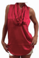
Blusa de Cetim