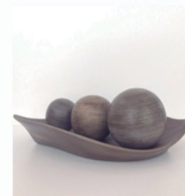
Fruteira com Três Bolas Marron