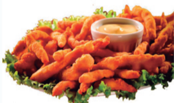
Isca de Frango à Milanese