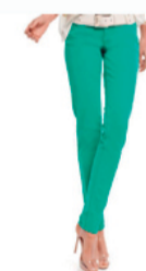
Calça Morena Rosa