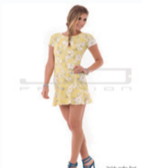
Vestido Jo Fashion