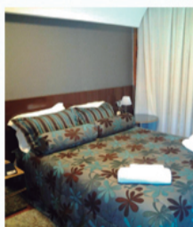
Luxo de Sexta a Domingo por casal