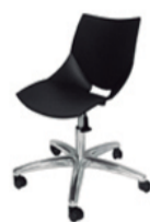
Blusa de Cetim