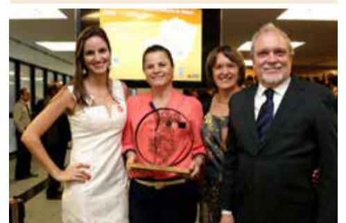
A Ramacrisna recebeu o prêmio Objetivos do Milênio Minas, projeto CAER (centro de Apoio Educacional Ramacrisna) a solenidade aconteceu na Cidade Administrativa no último dia 24/03