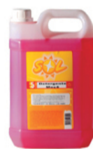
Detergente Líquido maçã 5 litros Sol