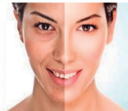
3 sessões de Peeling Clareador