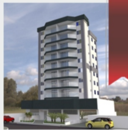
Almodóvar del Campo